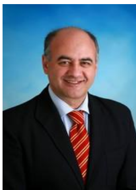
Miguel Ángel García Nieto Alcalde de Ávila

Volved cuando queráis. Os estaremos esperando. Recibid un fuerte abrazo